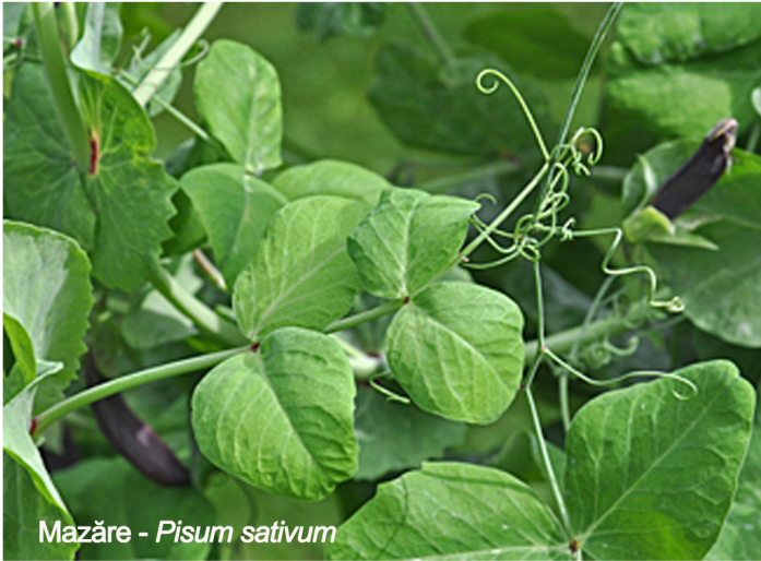
Mazăre - Pisum sativum

Frunzele sunt transformate total sau parțial în cârcei, care au proprietatea de a se înfășura în jurul unui suport susținând planta.